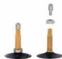
REGINA VALVOLA ITALIA Ø foro 6,2mm