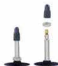
PRESTA VALVOLA FRANCIA Ø foro 6,2mm