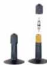
SCHRADER VALVOLA AMERICA Ø foro 8,3mm