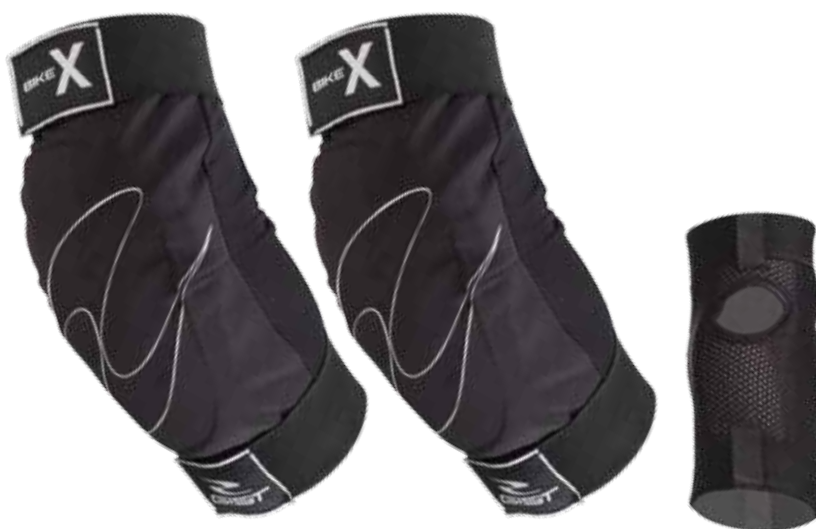
ART. 3220 - GOMITIERA - € 42,90