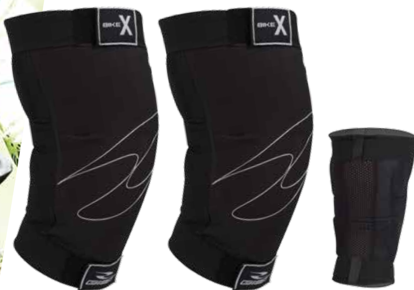
ART. 3221 - GINOCCHIERA - € 45,90