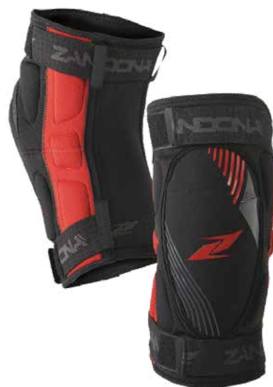
GINOCCHIERA SHORT - ART. 3236