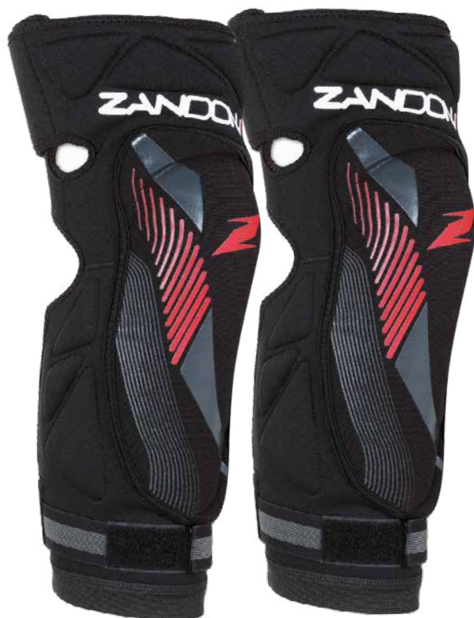
GINOCCHIERA - ART. 3237