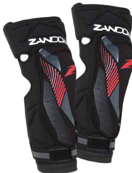
GOMITIERA - ART. 3117

Le "Soft Active Guard" sono studiate per difendere dagli urti e contusioni ginocchio e gomito, attutire piccoli urti sopra e di lato ad essi. Sono realizzate in neoprene traforato per la ventilazione, inserti elastici e chiusura in velcro posteriore. L'imbottitura interna è realizzata in E.V.C. (Evolved Viscoelastic Cells), innovativa gomma idrorepellente anti-shock ad alto rapporto performance/peso/spessore, completamente perforata per favorire la traspirazione dall'area a contatto con il corpo verso l'esterno. Il limitato spessore delle imbottiture, l'eccezionale vestibilità e l'applicazione di grip-siliconico sul lato interno degli elastici garantiscono un'ottima stabilità. Le dimensioni e la forma sono state studiate per seguire al meglio la struttura dell'arto evitando qualunque tipo di stress.